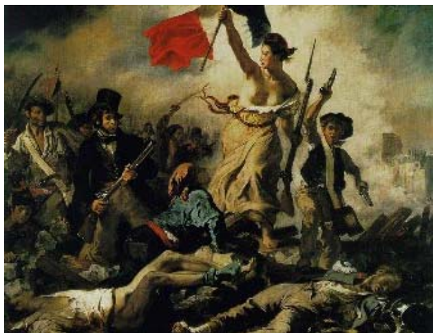
La libertad guiando al pueblo Eugène Delacroix, 1830

La palabra libertad se pronuncia casi siempre con un énfasis especial. Todos exigimos libertad y muchos están incluso dispuestos a luchar por ella. Al observar la situación internacional actual se constata que en muchos lugares se aspira a la autodeterminación y la libertad. ¿Qué se entiende en realidad por libertad? ¿De qué quiere liberarse el ser humano: del dolor y el sufrimiento, de limitaciones y obligaciones, de necesidades, de hambre y enfermedad? ¿Es esto la libertad? En los círculos astrológicos